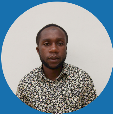
Ramadhan I. Mwinyi